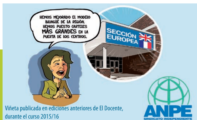
Viñeta publicada en ediciones anteriores de El Docente, durante el curso 2015/16

Por todo ello, el nuevo Decreto tiene que tener como objetivo -además de regular los programas lingüísticos- garantizar su buen funcionamiento, facilitando los recursos necesarios a través de una memoria económica. Desde ANPE consideramos que para que funcione un buen plan de enseñanza de lenguas extranjeras hay que hacer una inversión económica que garantice todo lo expuesto con anterioridad , sin perseguir intereses políticos centrados en poner la placa en el máximo número de centros posibles y sólo de cara a la sociedad.